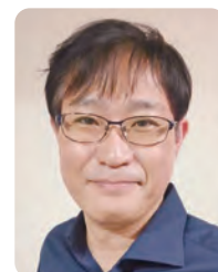
監修: 國澤 純先生

オティクスが生み出されるのをサポートする」方法と、「ポストバイオティクスの成分の入った食品やサプリメントをとる」方法の2つがあります。いずれの場合も極端な食生活はせず、いろいろなものをバランスよく取ることが肝要です。