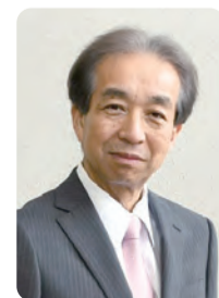
監修：内村 直尚先生

その意味で、男性の育児休業の取得や、2022年に新設された出生時育児休業の取得などは、もっと推進されてよいものです。女性の活躍推進には、十分な睡眠時間の確保という視点が不可欠です。