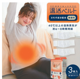
蒸気であったか 温活ベルト (3枚入×5箱)