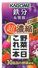
野菜一日これ一本 超濃縮 鉄分&葉酸 (125mL×24本)