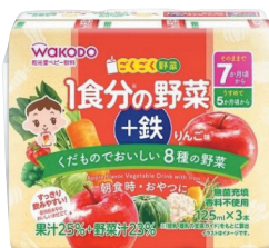
ごくごく野菜 1食分の野菜+鉄 りんご味 (125mL×48本)