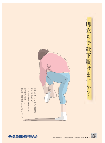
健康保険組合連合会

筋力は若い時から維持することが重要です。ただ、家事・労働・通勤・通学など日常生活における活動量だけでは、十分といえないかもしれません。そこで、「健康マメ知識」では国のガイドが推奨している「筋力トレーニング（筋トレ）」を紹介しています。