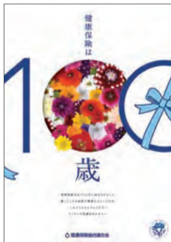
▲健保法制定100周年を記念したイメージポスター